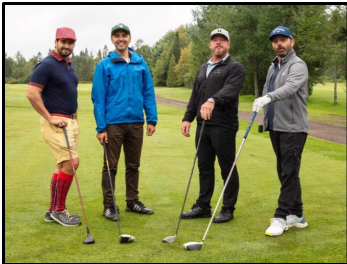
Le Régiment de Trois-Rivières était bien représenté !

Le tournoi s'est terminé par un fabuleux repas au pavillon du Club et la remise de plusieurs prix de compétition et de participation.