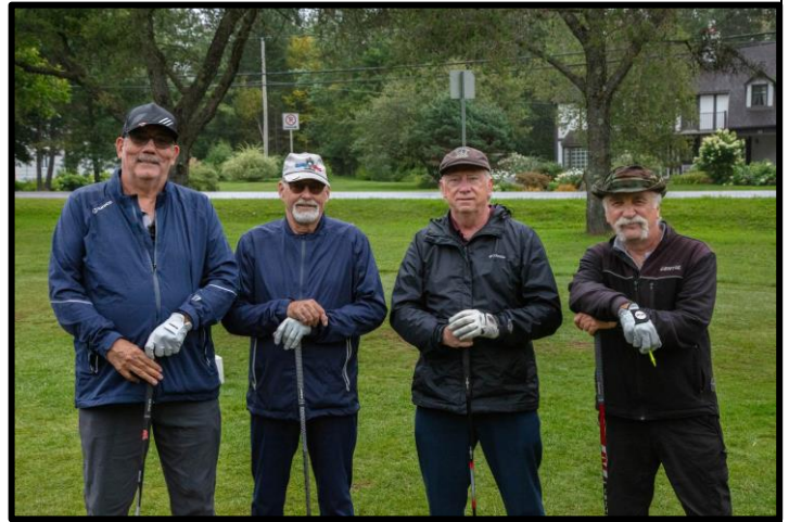
C'est toujours agréable de revoir des anciens !

Pour l'occasion, trente-six (36) quatuors s'étaient donné rendez-vous. Il y avait une belle représentation de toutes les composantes de la grande famille régimentaire, c'est-à-dire, le 12 e RBC (VA), le 12 e RBC (TR), les retraités, des membres de l'Ordre de l'Étoile de Trois-Rivières ainsi que plusieurs partenaires et commanditaires de l'Association.